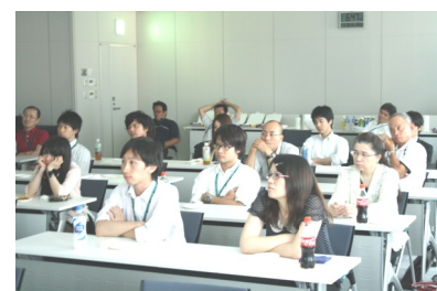
真剣に見入る組合員の皆さま

樺太においてはソ連軍が終戦を無視して侵攻を図った。在任の邦人が混乱を極める中、唯一の情報手段である電話を死守するため、最後まで職務を全うし亡くなっていた九名の電話交換手の痛ましい実話であった。侵攻するソ連軍には憤りを感ずるが、一人の人間としてみた場合、国は違っても誰も人を傷つけたくはないはずである。すべては戦争という異常な状況になったとき誰もが望まない悲惨な