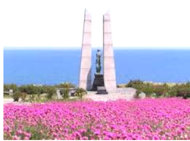
氷雪の門(樺太島民慰霊碑)

内容は、無条件降伏をした一九四五年八月十五日。誰もがこれで戦争は終結したという安堵感がある中、