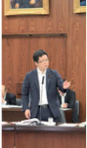
『マイナンバー関連法案』で質問 (2015)