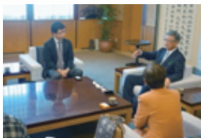
沖縄で翁長沖縄県知事に面会(2015)