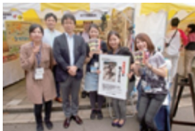
グローバルフェスタの NTT労組ブース