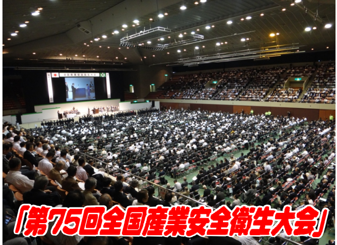
「第75回全国産業安全衛生大会」

二〇一六年一月十九日(水)～二十一日(金)に仙台にて、「第七十五回全国産業安全衛生大会」が開催された。